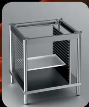
PODSTAWAWA /WYMIARY/ (GN1/1, 400x600)