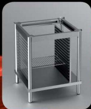
PODSTAWA /WYMIARY/ (2/3GN, 440x350)