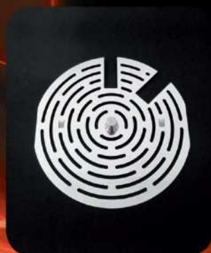
DYSK REDUKUJĄCY NAWIEW POWIETRZA